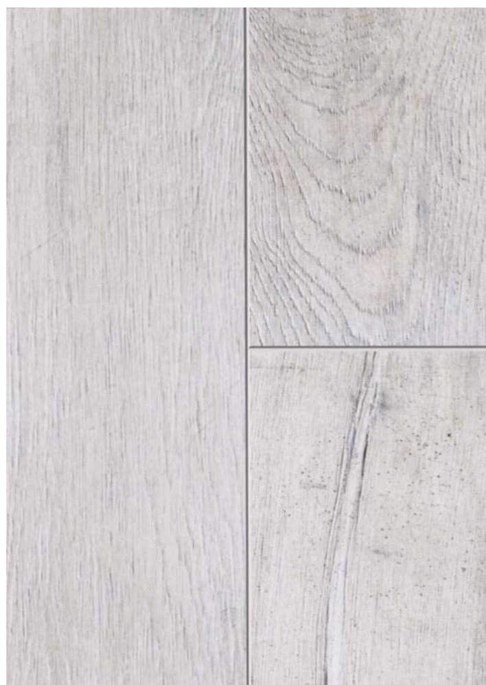
BROWNSHADED 1260 x 173 x 4.5 mm

PISO ECOLOGICO BASE MINERAL MICRO BISEL SSISTEMA CLICK