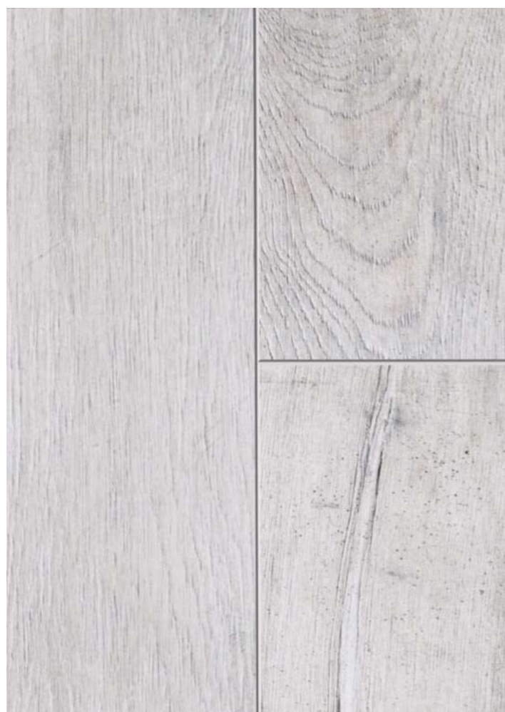
ELM SILVERGREY 40922 1260 x 173 x 4.5 mm

PISO ECOLOGICO BASE MINERAL MICRO BISEL SSISTEMA CLICK